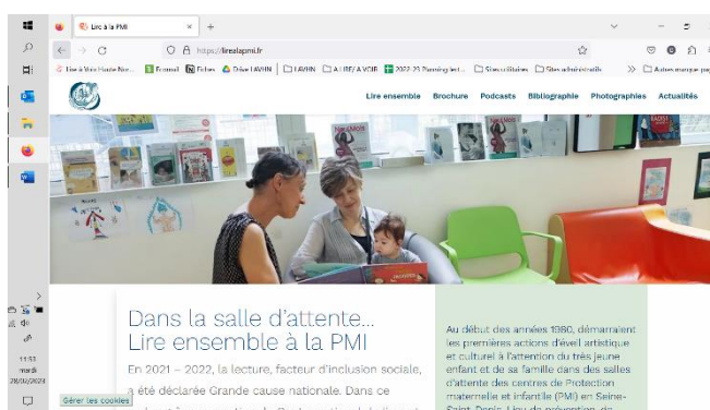
Le site internet

Depuis février 2022, LAVHN fait partie du comité de pilotage du projet « Lire à la PMI ». 6 réunions de coordination de ce projet ont été organisées en 2022 pour penser et construire des ressources afin de réaffirmer l'importance des lectures en salles d'attente de consultation de PMI : une brochure, une série de podcasts, une bibliographie évolutive et une exposition photographique en ligne. LAVHN a été sollicitée pour une interview pour les podcasts, a participé à la rédaction d'un court texte et à la constitution de la bibliographie.