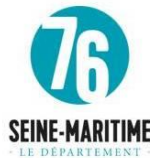
Le Département de Seine Maritime : service Culture