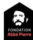
La Fondation Abbé Pierre