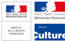
La DRAC Normandie